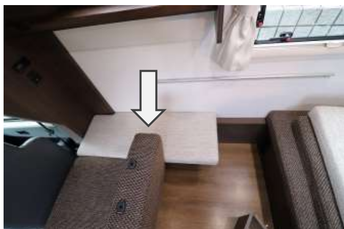
マットを置きます。