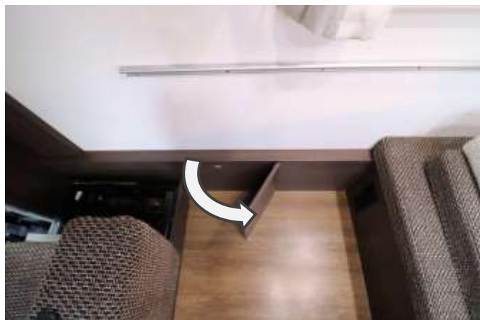
マットを支える板を 60° くらい開きます。