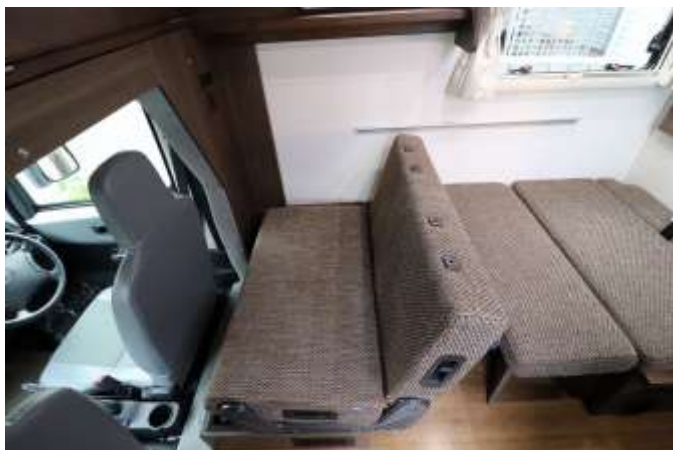
背もたれを倒した状態