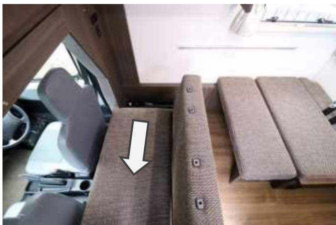
座席下のレバーを操作して座席をスライドします