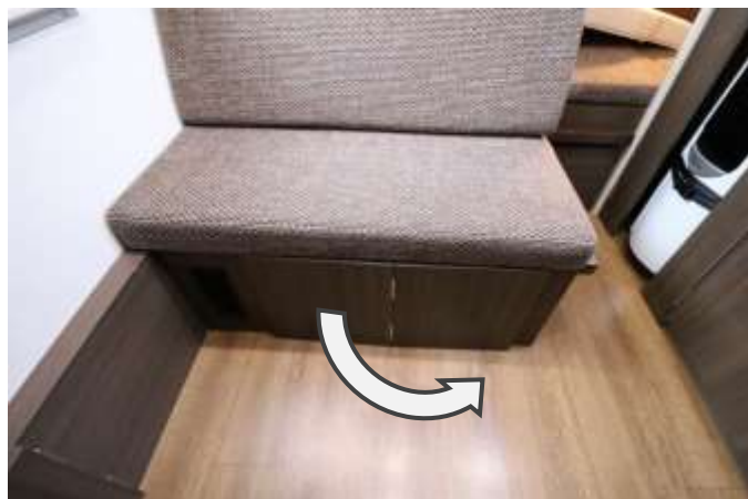
支えの板を開きます。